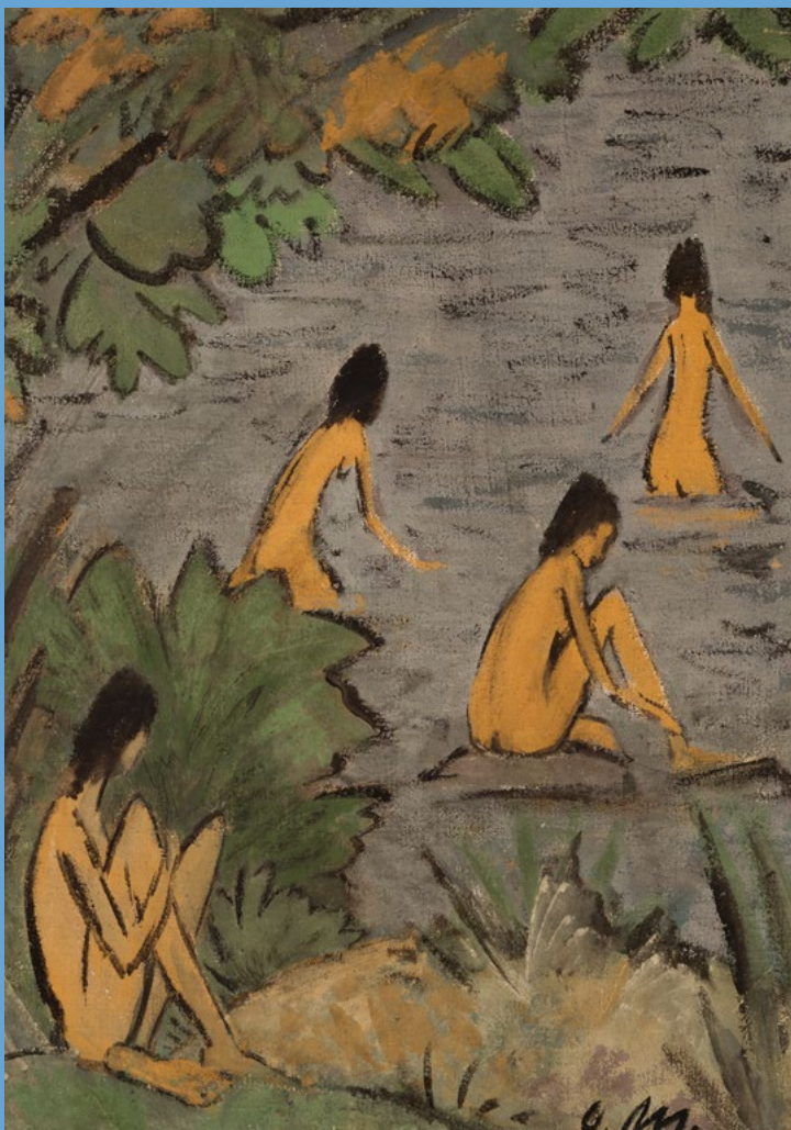
➤ Otto Mueller, Landschaft mit Badenden, um 1915

Wälder, Wiesen und Wasser – auch Menschen gehören zu Otto Muellers Lieblingsmotiven, zum Beispiel am See als Nacktbadende. Mensch und Natur wirken im Zusammenspiel ganz friedlich. So stellte der Künstler sich vermutlich das perfekte Leben vor.